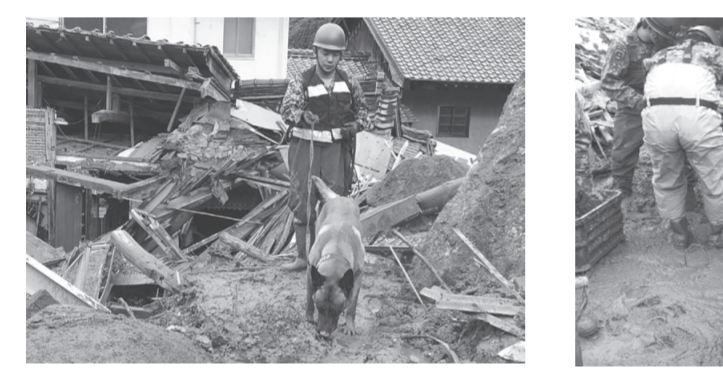
佐賀県唐津市の土砂崩れ現場での捜索犬による捜索

鹿児島県 6月21日、鹿児島県瀬戸内町(奄美大島)では水源地の排水管に土砂が流入し4千戸に断水が発生。鹿児島県知事から陸上自衛隊司令部に給水支援に係る災害派遣要請があり、奄美警備隊と海自奄美基地分遣隊が22日までの間、延べ60名による給水支援を実施した。