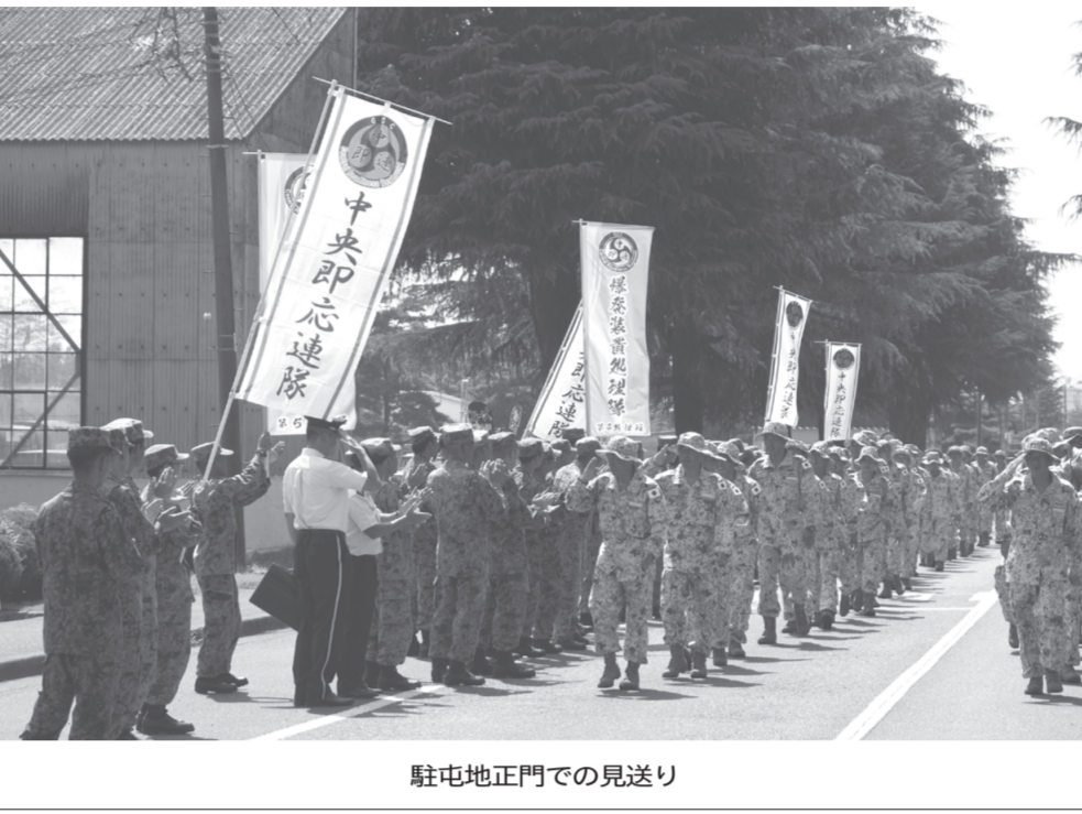
駐屯地正門での見送り