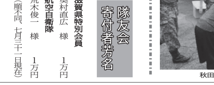
秋田県男鹿市での給水支援活動

7月14日、秋田県で土砂災害の影響で排水管が破損、男鹿市、山本郡八峰町及び南秋田郡五城目町の約8千戸で断水が発生。秋田県知事から第21普通科連隊長(秋田)に給水支援に係る災害派遣要請があり、21普通科連隊長(秋田)は、16日には秋田市内の中通総合病院の入院患者16名の緊急患者輸送が集中し、夜間は自衛隊が集積場から仮置き場までの輸送を実施する共済活動を実施した。