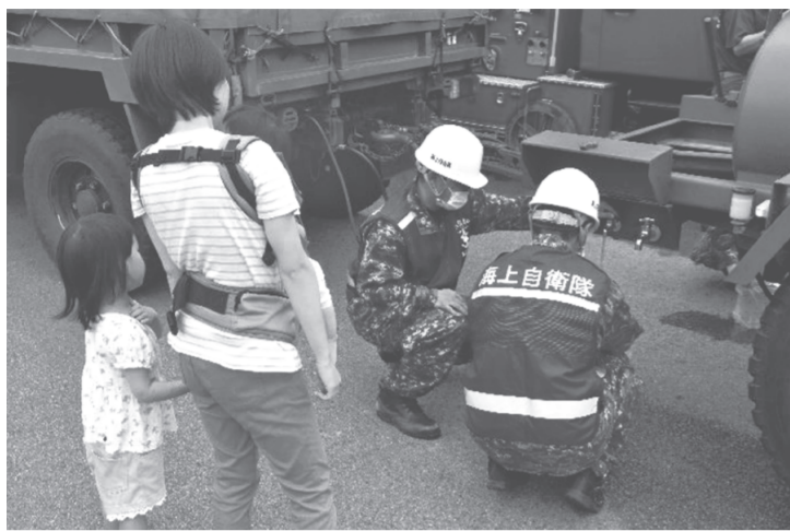
鹿児島県瀬戸内町での給水支援

6月下旬から7月中旬にかけて、九州から日本海側の各地は、梅雨前線付近の線状降水帯による大雨により各地で土砂災害が発生、被害の大きい地域の県知事からの要請により自衛隊は災害派遣に動いた。