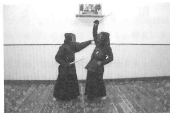
右腕を上方に制体