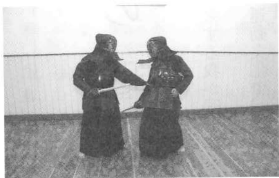
右腕を下方に制体