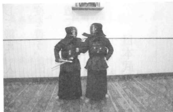
右腕を抱え込む制体